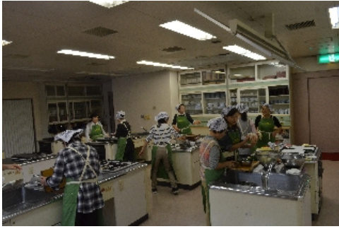
裾野市食育推進会の調理風景