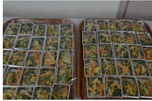
野菜のピーナッツ和え

裾野市の月例イベントである”寄り道ウォーキング”の場で、食育健康推進会が提供する食生活改善の目玉である減塩を目指した健康食が振る舞われています。